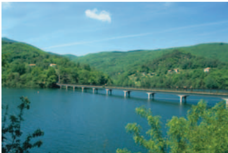
Valle Bormida: il lago di Osiglia