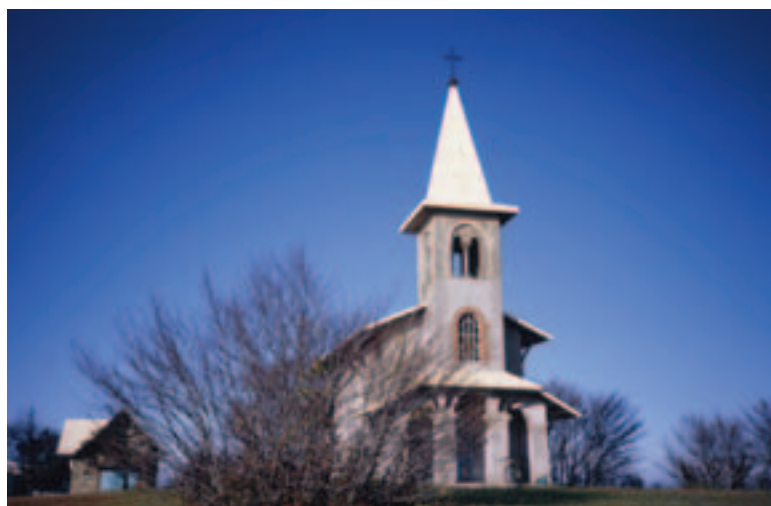
Monte Beigua: il Santuario Regina Pacis